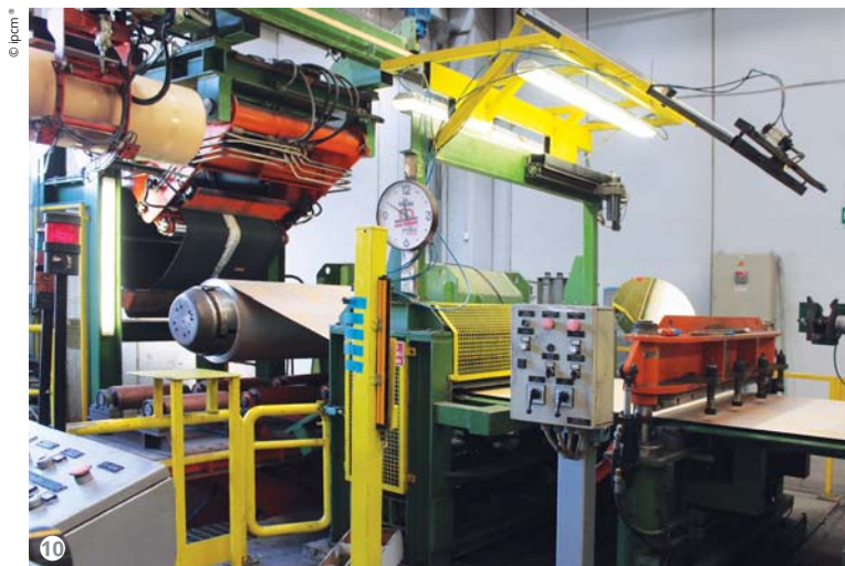
Figura 10: La parte finale dell'impianto, con il sistema di riavvolgimento del nastro.