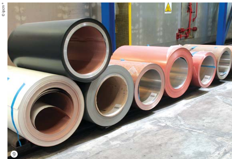
Figura 9: Coil verniciati con vari effetti: dalla finitura "rame" a quella simil-ossidata fino all'effetto opaco.

"L'esperienza ci ha insegnato che il controllo del processo produttivo incide molto sulla qualità finale del pezzo. In DN Chemicals abbiamo trovato un partner che condivide questo pensiero e quindi in grado di proporre soluzioni per far fronte a questa esigenza e metterci nella posizione di dare maggiori garanzie ai nostri clienti. Abbiamo avuto modo di testare diversi prodotti chimici di pretrattamento ma nella tecnologia DN Chemicals abbiamo trovato le soluzioni più solide, oltre ad un servizio di assistenza immediato e competente. Sono stati in grado di proporci un processo versatile, all'avanguardia e unico nel suo genere, che contribuirà a migliorare ancora di più la