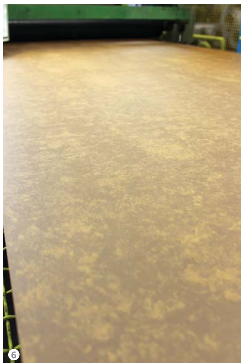
Figura 6: Il nastro verniciato all'uscita dal forno di cottura transita in una zona dedicata al controllo qualità.

Le linee di verniciatura L'impianto di verniciatura a liquido prevede un'applicazione wet-on-wet con una prima testa verniciante che applica il prodotto contemporaneamente su due lati (fig. 8) e un forno di 15 metri, composto da una parte dedicata all'asciugatura ad aria e una di raffreddamento con acqua demineralizzata, che porta il metallo a una temperatura di 30 gradi. Uscendo dal tunnel di raffreddamento, il nastro torna all'interno della medesima cabina di verniciatura dove una seconda testa verniciante applica il colore oppure, grazie a rulli fotoincisi, una particolare finitura, come