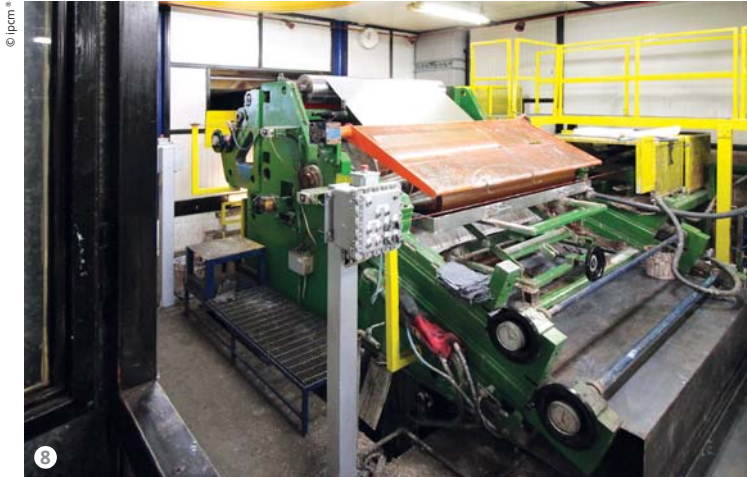
Figura 8: Una testa verniciante con prodotti liquidi.

risulta pulita e priva di residui di polvere. Ciò permette anche di mantenere il controllo degli spessori e di evitare problemi di qualità durante la pressopiegatura dell'alluminio verniciato (fig. 12)".