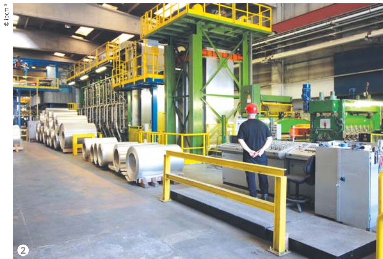
Figura 2: L'impianto per la verniciatura liquida in grado di trattare lamiere da 0,25 mm fino a 1,5 mm di spessore.