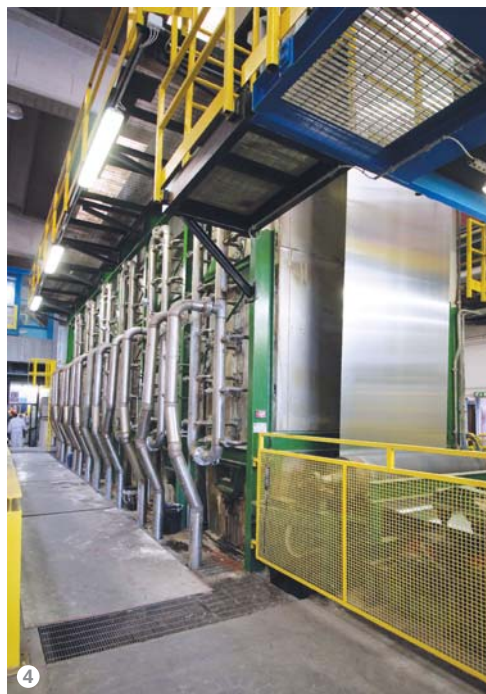
Figura 4: Il tunnel di pretrattamento.

Lo scorso luglio è stato concluso l'ultimo test per stabilire la funzionalità dell'impianto, che sarà in seguito installato in via definitiva.