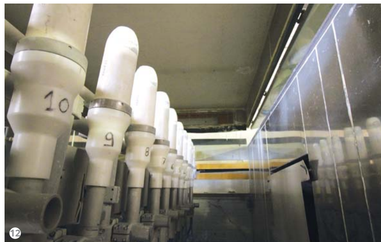
Figura 12: La batteria di erogatori per le polveri.

“ DN Chemicals ha condotto una serie di prove industriali per analizzare e selezionare i prodotti e il tipo di applicazione migliori per una preparazione ottimale del coil, senza comprometterne le proprietà meccaniche. Dopo l'applicazione di vari prodotti su diverse leghe, a diverse velocità, e dopo l'esecuzione dei test meccanici, come prove di piegatura multipla o impact test, sono stati raccolti e analizzati i dati per capire se fosse possibile passare all'applicazione del prodotto di conversione finale non più per aspersione, come viene fatto oggi, ma tramite nebulizzazione. Ha quindi installato dei prototipi di rampe di nebulizzazione su entrambi gli impianti, che stanno mettendo a punto per poi procedere a un'installazione definitiva.”