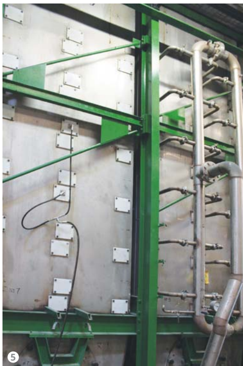
Figura 5: Sulla parte finale del tunnel di pretrattamento, sono stati installati dei prototipi di rampe di nebulizzazione.

rinnovamento del processo produttivo che prevede la presenza di due impianti di verniciatura dotati di accumulatori sia in ingresso sia in uscita che consentono la verniciatura in continuo senza mai fermare l'impianto, nemmeno durante la fase di cambio colore o di taglio del nastro metallico alla fine del processo (fig. 7).