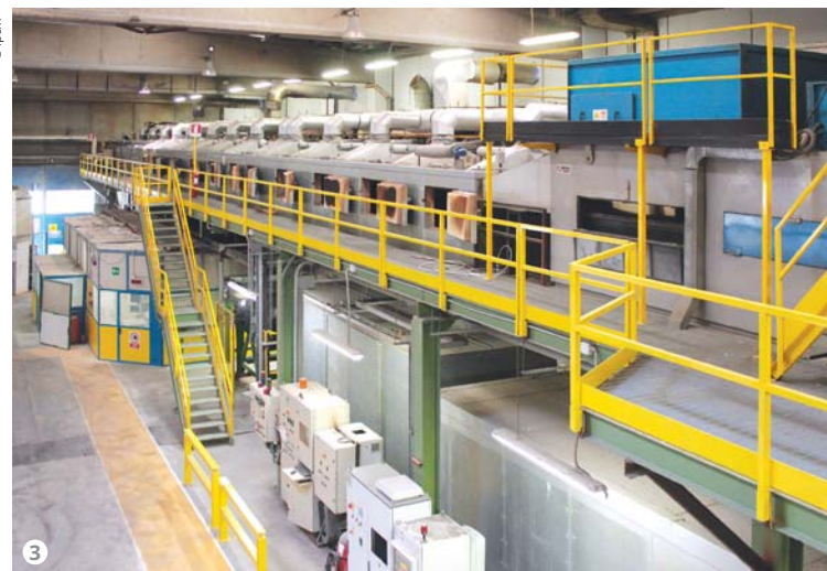
Figura 3: L'impianto ibrido è in grado di verniciare coil fino a 3,05 mm di spessore sia a polvere sia a liquido.

prodotti su diverse leghe, a diverse velocità, e dopo l'esecuzione dei test meccanici, come prove di piegatura multipla o impact test , sono stati raccolti e analizzati i dati per capire se fosse possibile passare all'applicazione del prodotto di conversione finale non più per asperazione, come viene fatto oggi, ma tramite nebulizzazione", spiega Bernasconi. "Abbiamo quindi installato dei prototipi di rampe di nebulizzazione su entrambi gli impianti, che stiamo mettendo a punto per poi procedere a un'installazione definitiva (fig. 5)".